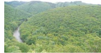
Un des paysages les plus grandioses et sauvages du territoire du Parc : la vallée de l'Ourthe en aval du Cheslé. Très beaux versants boisés de feuillus. Le surgissement de l'Ourthe au sein du paysage fait figure d'élément de surprise.