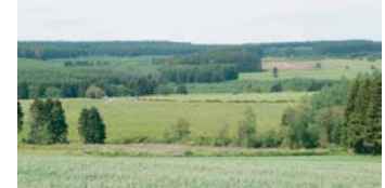
Vue transversale sur la vallée de l'Ourthe orientale en aval de Deiffelt, lorsqu'elle présente un caractère encore ouvert.