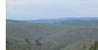
Ce tronçon de la rivière se marque par une profonde vallée, formant des entailles étroites et sinueuses.