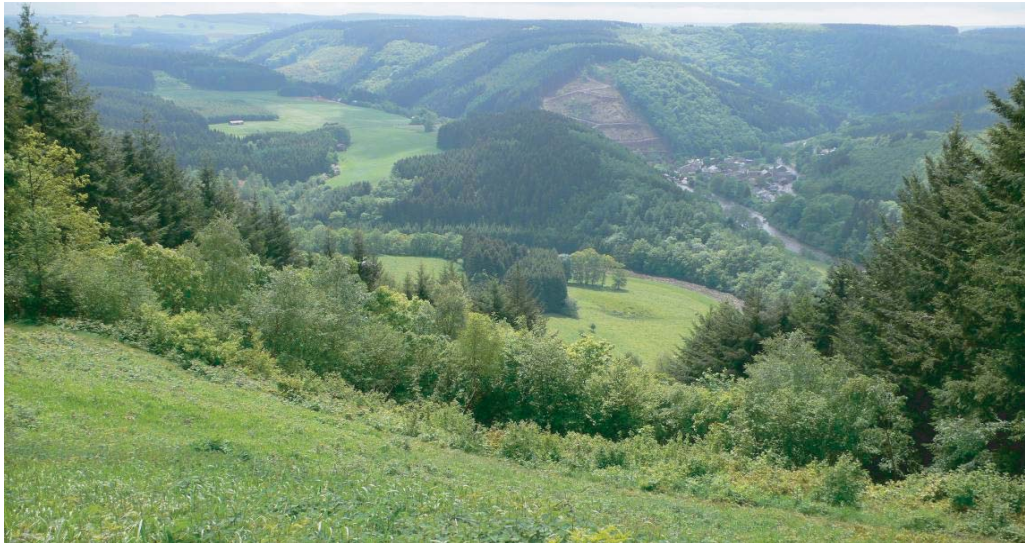
Vue sur Maboge depuis les hauteurs de Bérismenil